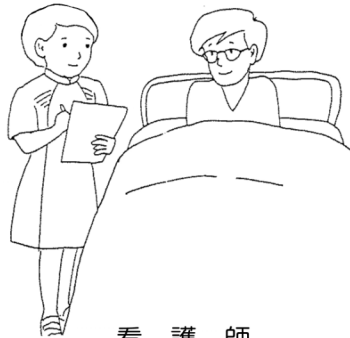
看 護 師

医療チームのリーダーとして明確な医療方針を示します。病状を把握、診断し、皆さんに詳しく説明した上で適切な治療を行います。